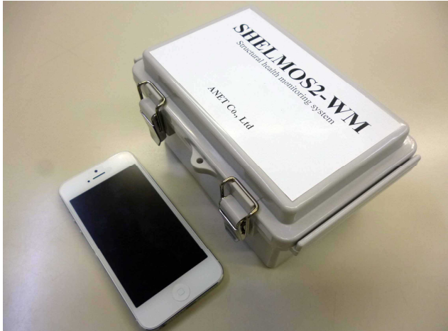
下: iPhone5 (大きさ比較用)