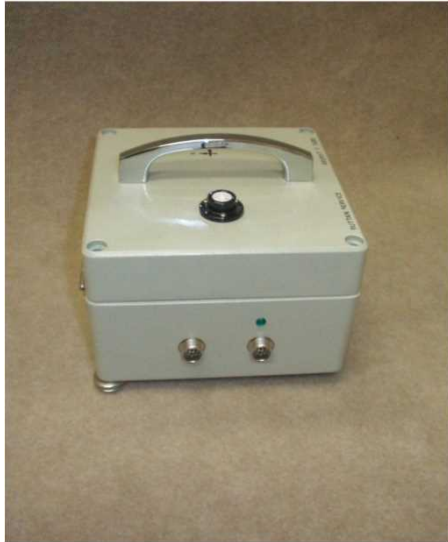
写真はGPS対応型です