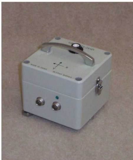
写真はGPS対応型です